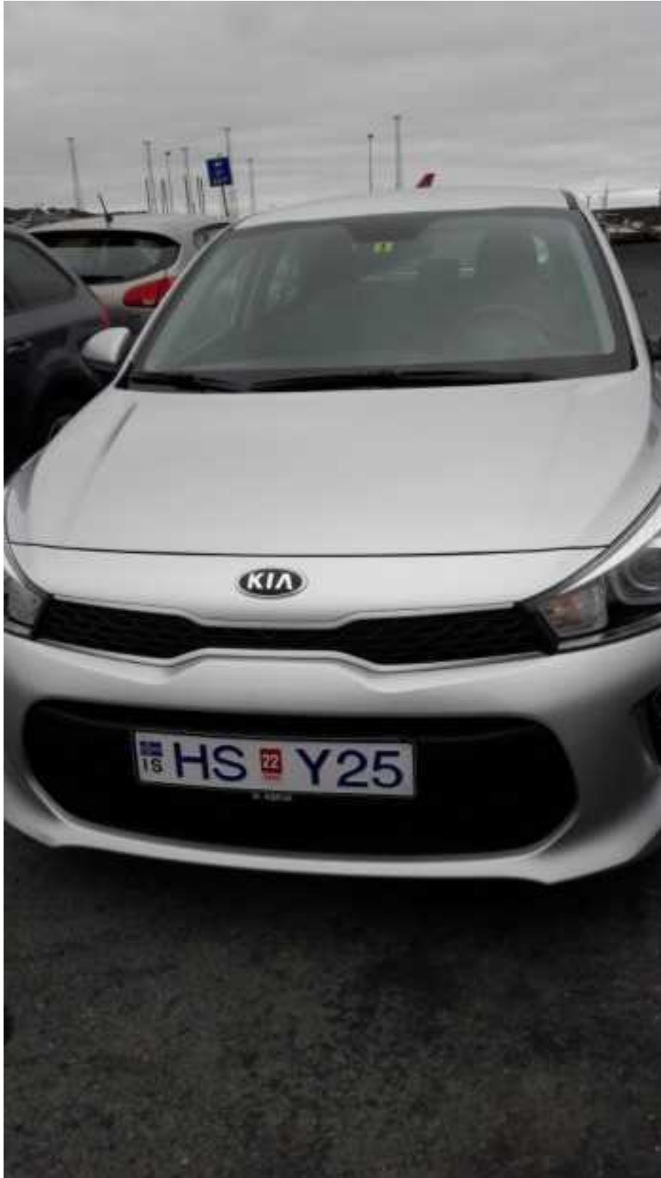
Serge Lagarde (c)