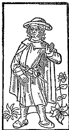
Image censée représenter François Villon dans la plus ancienne édition de ses œuvres

Son œuvre n'est pas d'accès facile sans notes et sans explications. Sa langue ne nous est pas toujours accessible. Les allusions au Paris de son époque, son art du double sens et de l'antiphrase rendent souvent son texte difficile, même si l'érudition contemporaine a éclairci beaucoup de ses obscurités.