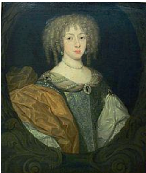
La princesse Palatine (1652-1722)

« Faites ce que je dis, ne faites pas ce que je fais »