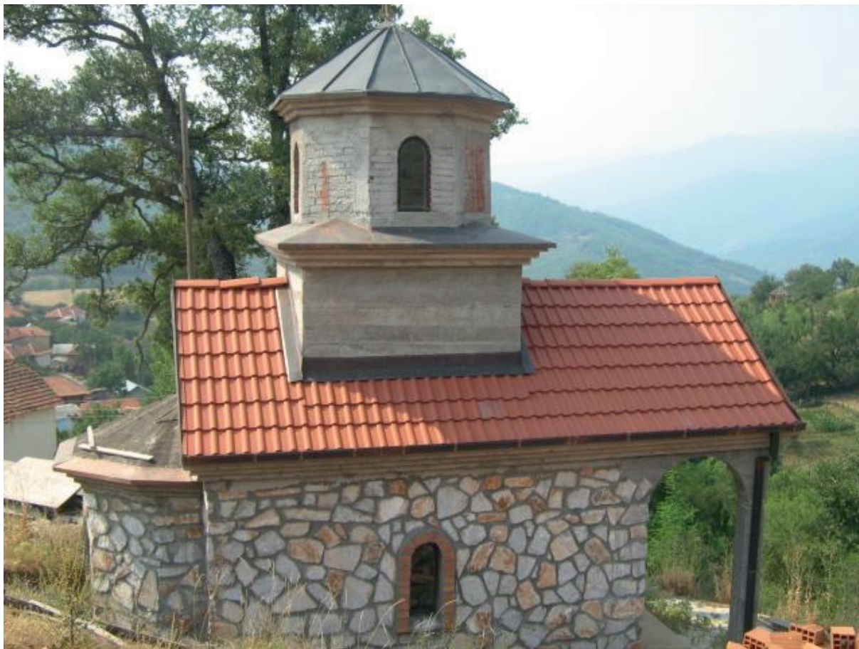
L'église du village de Brest

Brest est un village de l'ouest de la Macédoine du Nord, situé dans la municipalité de Makedonski Brod. Le village comptait 189 habitants en 2002.