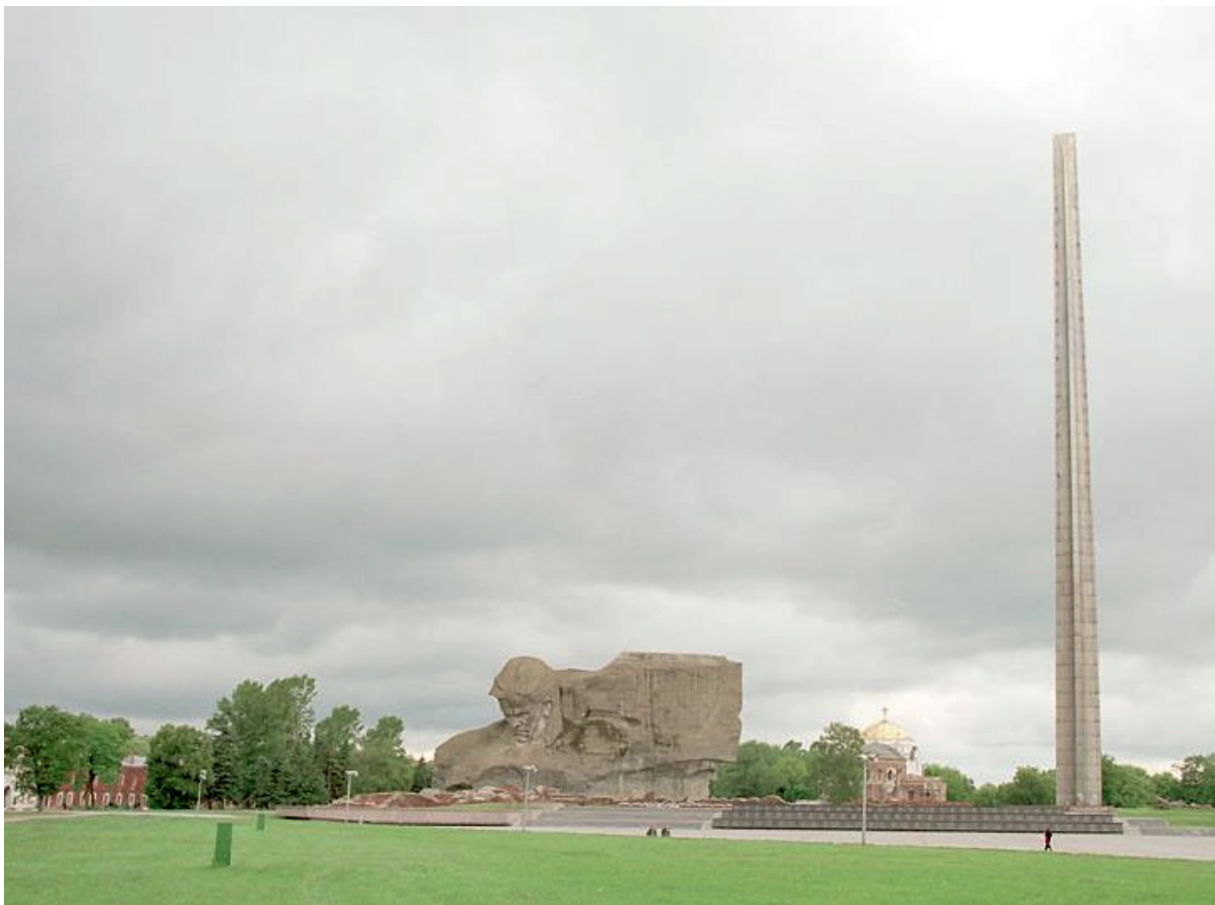
Le mémorial de Brest (1941)

Brest ou Brest-Litovsk ? Sous l'Empire russe, la ville s'appelle Brest-Litovsk (littéralement, « la Brest lituanienne »). Après la Première Guerre mondiale, quand elle a été intégrée à la Pologne, elle a été rebaptisée Brześć nad Bugiem (« Brest-sur-le-Bourg », la rivière qui la traverse). Puis, intégrée à la Biélorussie après la Seconde Guerre mondiale, elle est devenue simplement « Brest ».