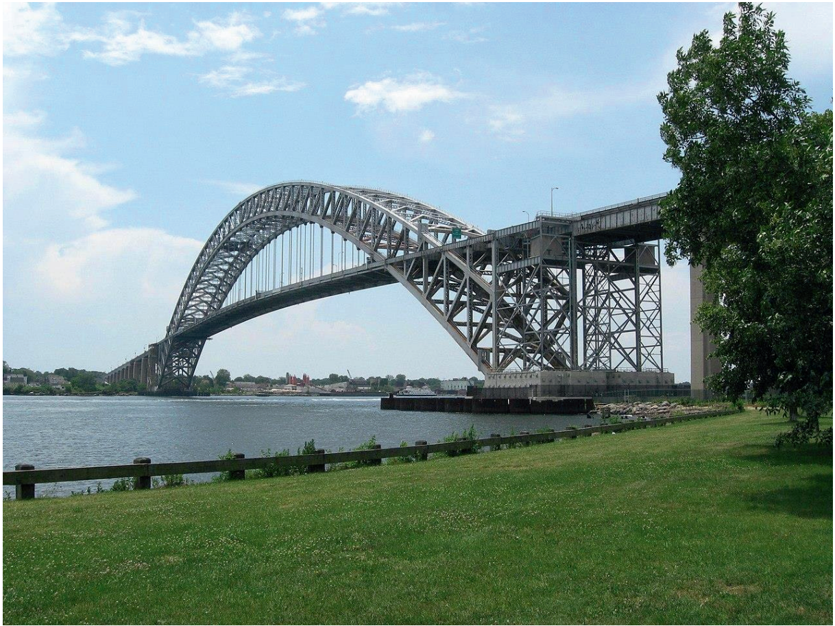
Le pont de Bayonne