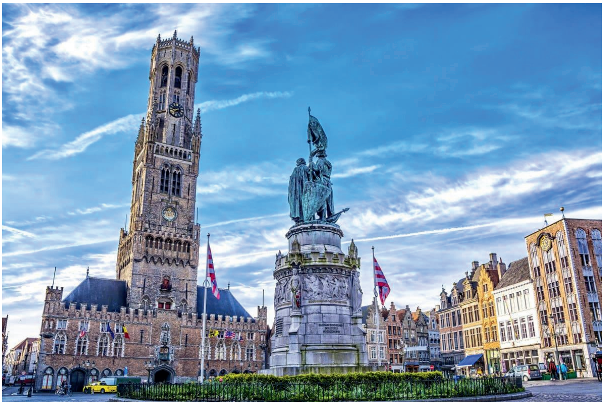
Le beffroi de Bruges

Haut de 83 mètres, le beffroi de Bruges qui est la tour la plus importante de la ville, renferme un impressionnant mécanisme d'horlogerie et un carillon qui compte 47 cloches.