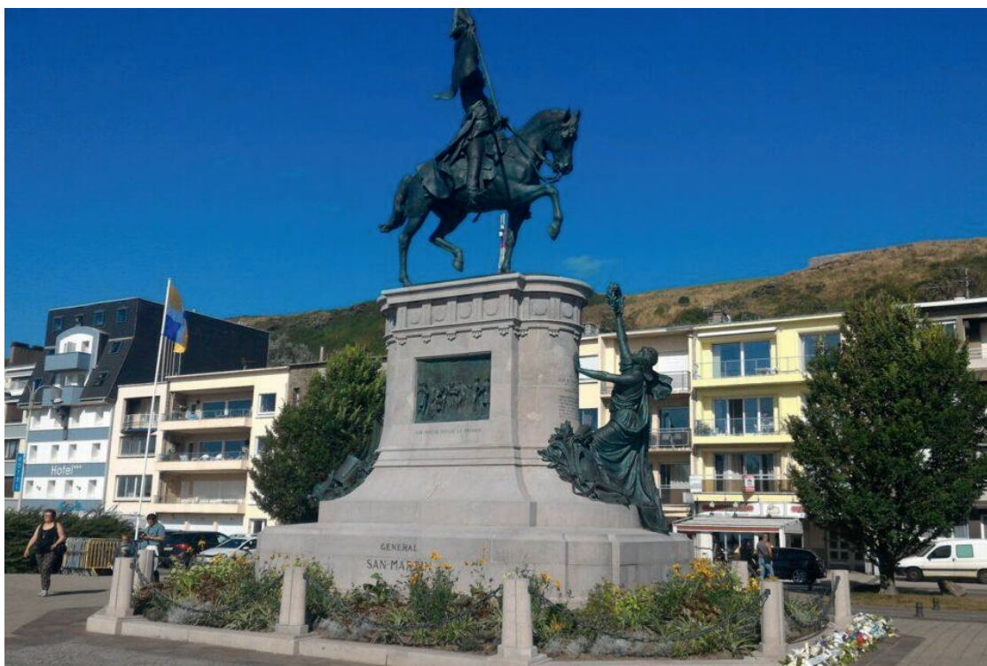
Statue équestre du Général San Martin, à Calais.

José de San Martin s'est battu contre les Espagnols et a libéré l'Argentine, apprend-on sur le site de Tourisme en Côte d'Opale. Mais l'histoire est parfois cruelle, le général est contraint de fuir le pays suite à des désaccords politiques. Il se retrouve donc en Europe, en exil, et arrive à Boulogne-sur-Mer en 1848.