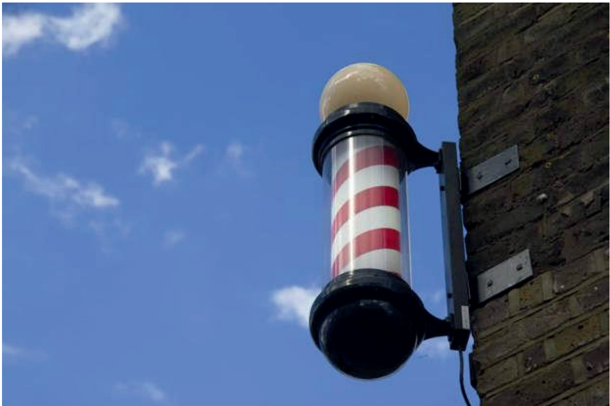
Le poteau de barbier

L'origine du poteau de barbier en forme de canne à sucre est plus sombre qu'on ne le pense... Autrefois, les barbiers étaient à la fois des chirurgiens et des dentistes. Un bâton blanc était utilisé pour les saignées, et le barbier utilisait un tissu pour arrêter le saignement, puis l'enroulait autour du bâton et le mettait à sécher dehors. Vous regarderez votre barbier autrement !