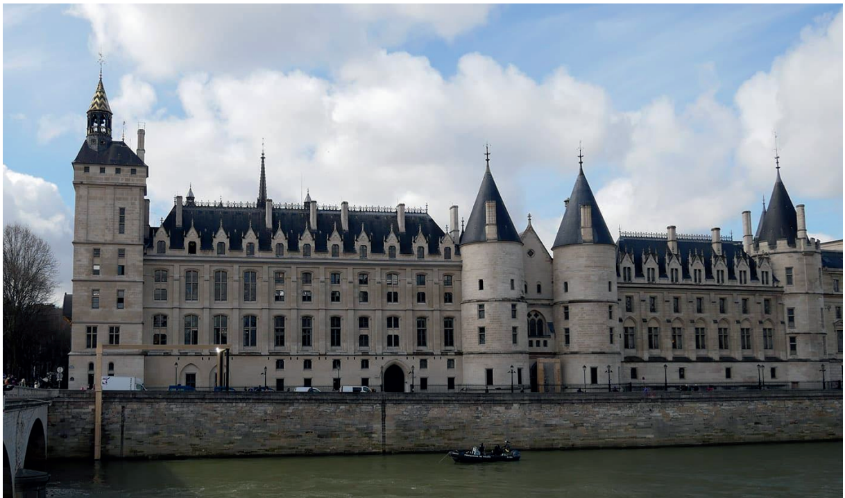
Vue d'extérieur de la Conciergerie