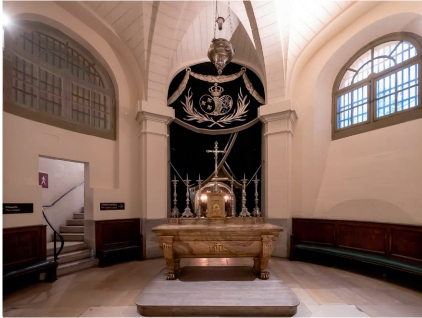
Chapelle commémorative dédiée à Marie-Antoinette