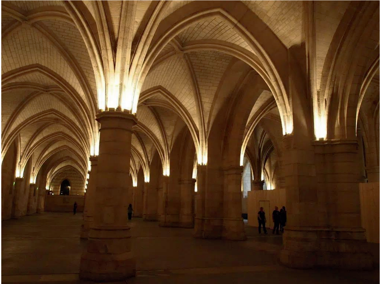
La salles des gardes de la Conciergerie

d'accueillir près de 2000 personnes qui pouvaient s'y sustenter grâce aux cuisines accolées, édifiées sous Jean le Bon