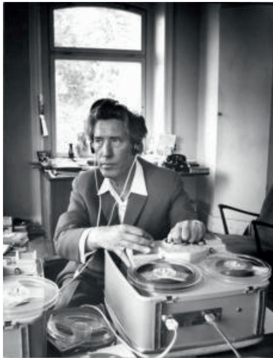
Jürgenson reçoit ses premières voix

Cinéaste de renommée, il a été considéré comme l'ancêtre des enregistrements de voix. Il se qualifiait lui-même de « hérald de l'immortalité . »