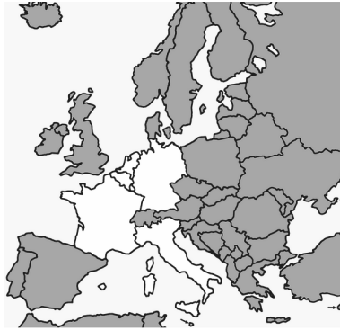
L'Union européenne en 1957

L'Union européenne a été fondée en 1957 par 6 pays : l'Allemagne, la Belgique, la France, l'Italie, le Luxembourg et les Pays-Bas.