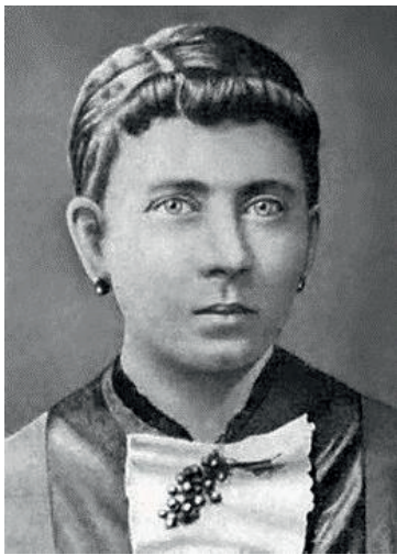
Klara Hitler (1860-1907)

L'héritière accepte d'abandonner ses droits et de faire retirer la pierre tombale, le 27 mars 2012, sans aucune cérémonie. L'emplacement de la tombe, alors couvert d'un carré de gravier blanc et marqué par un arbre distinctif, reste cependant facile à localiser.