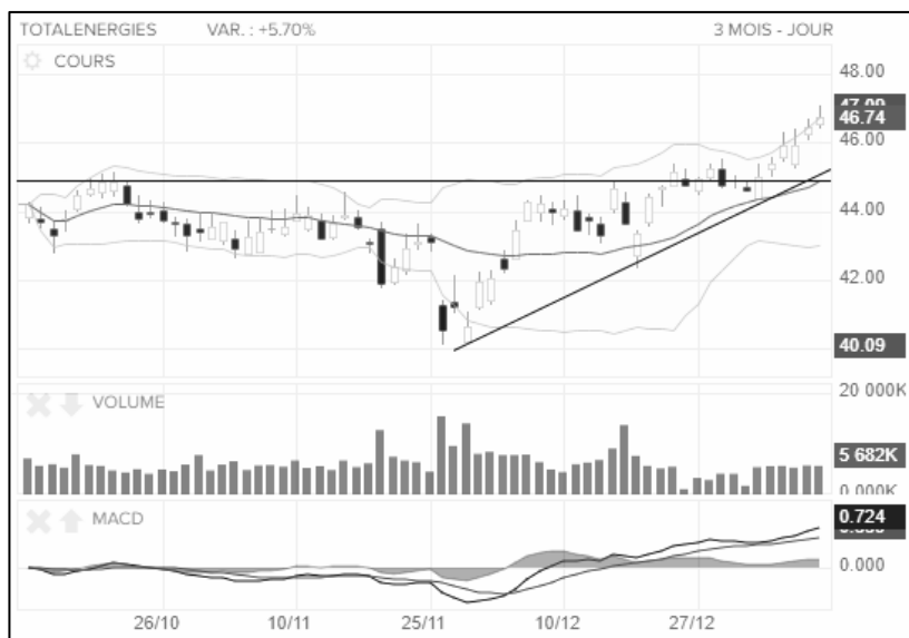
Exemple de graphique boursier Boursorama avec indicateurs

Ce qui peut vous sembler être un bazar incompréhensible est en réalité une mine d'or d'informations concernant le cours actuel et passé.