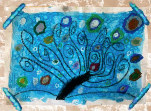
Maxime 6ans 1/2