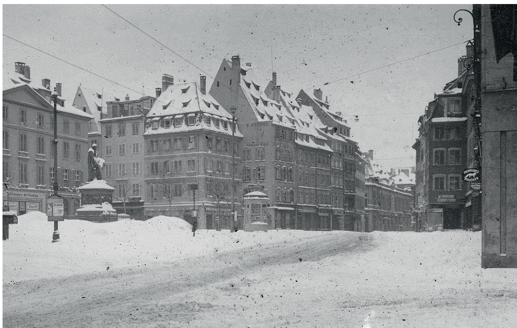
Place Gutenberg en 1939