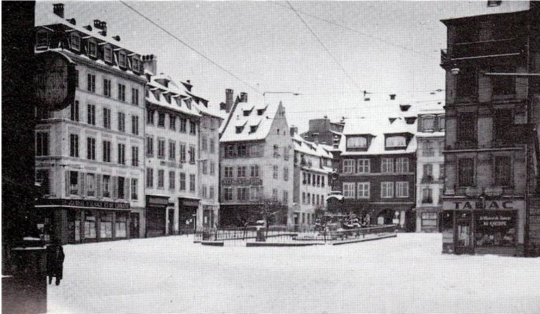
Place du vieux marché aux vins sous la neige durant l'hiver rigoureux début 1940