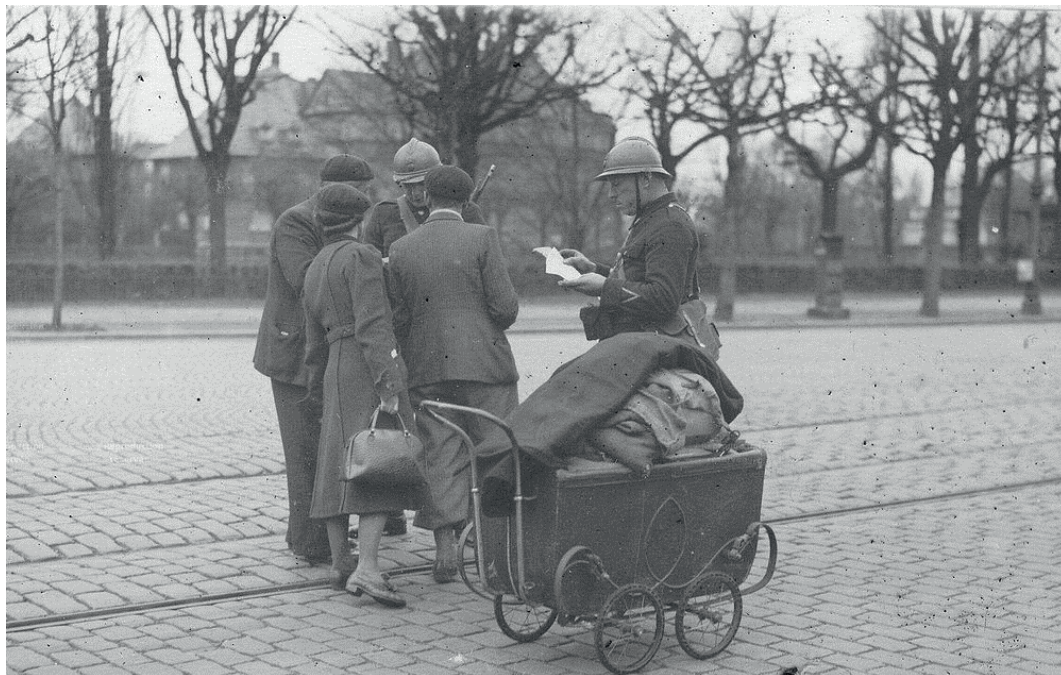
Gendarmes et gardes municipaux sur un contrôle d'identité en 1939