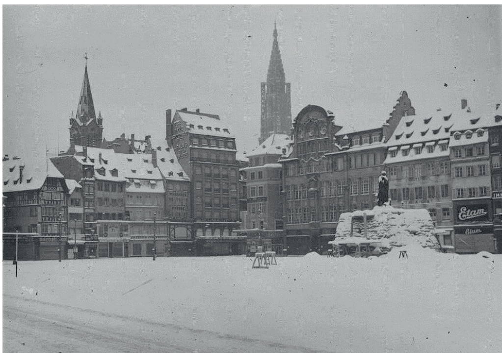
Place Kléber, hiver 39-40