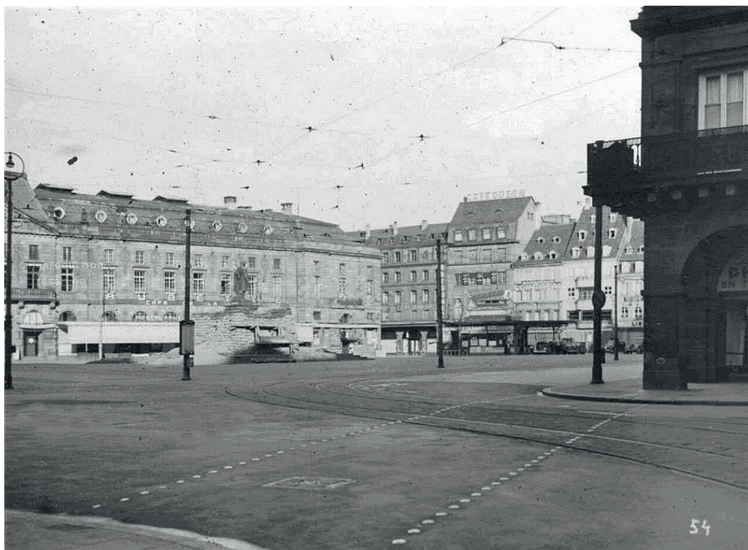
Coin de la Place Kléber