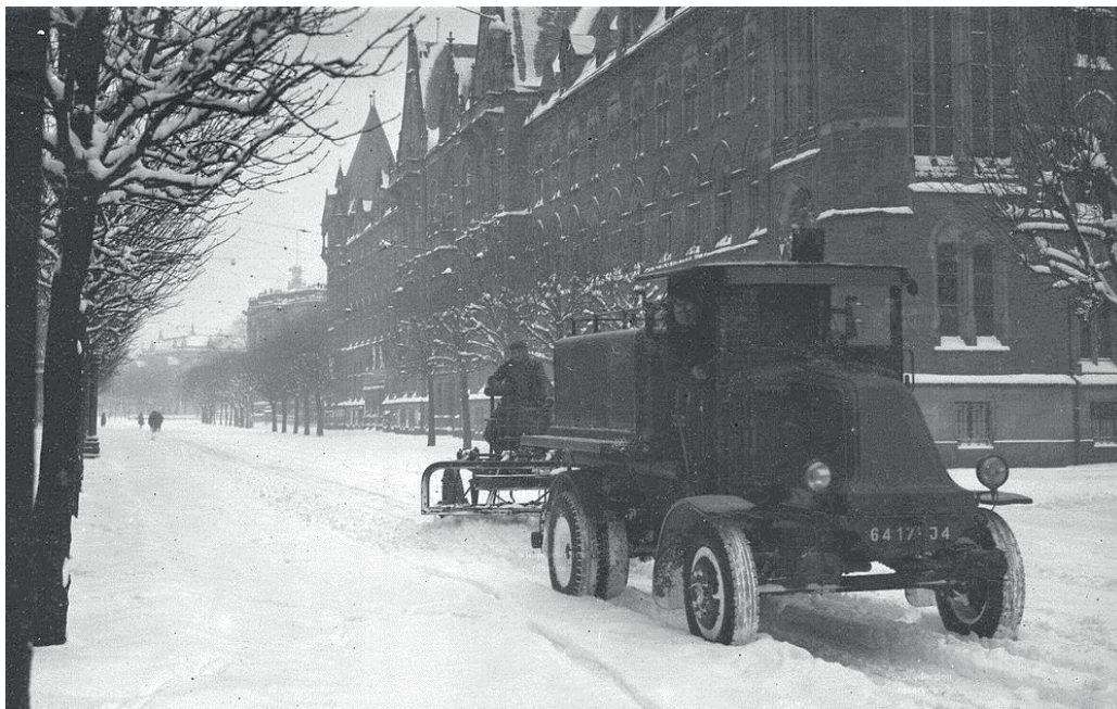
Chasse-neige avenue de la Marseillaise en 1939