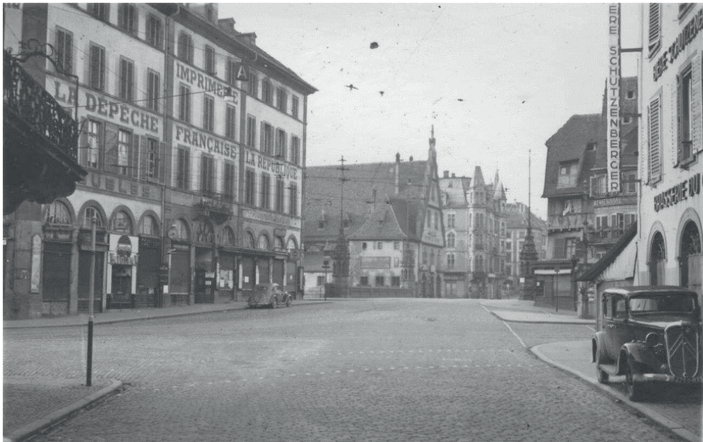
Place du corbeau octobre 1939