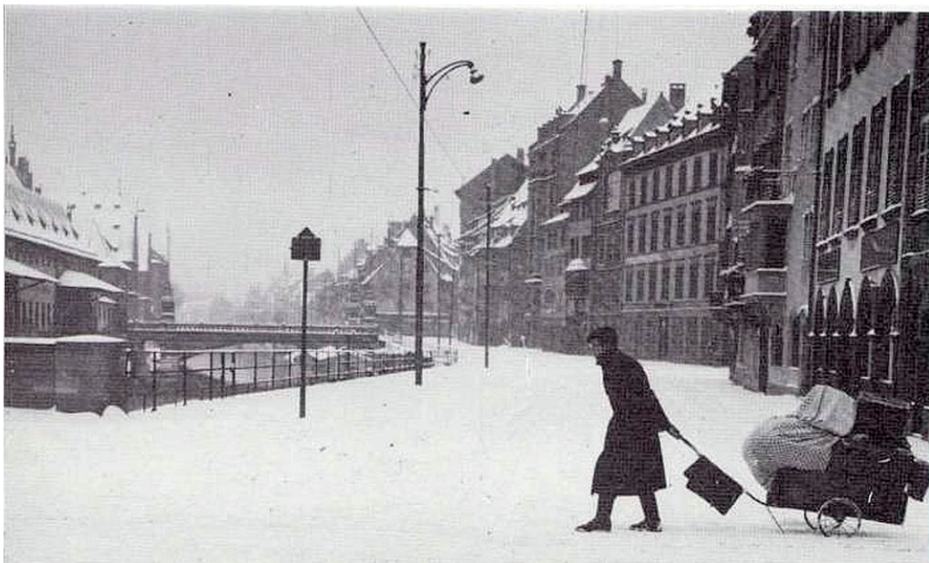
Quai Saint-Nicolas, hiver 39-40