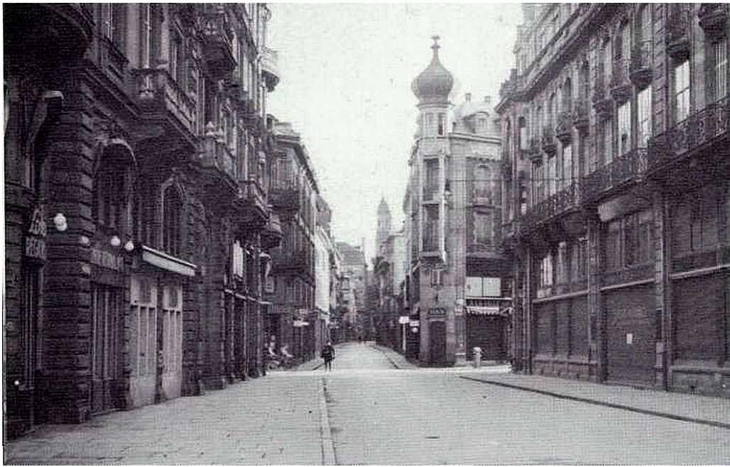
Rue du Dôme