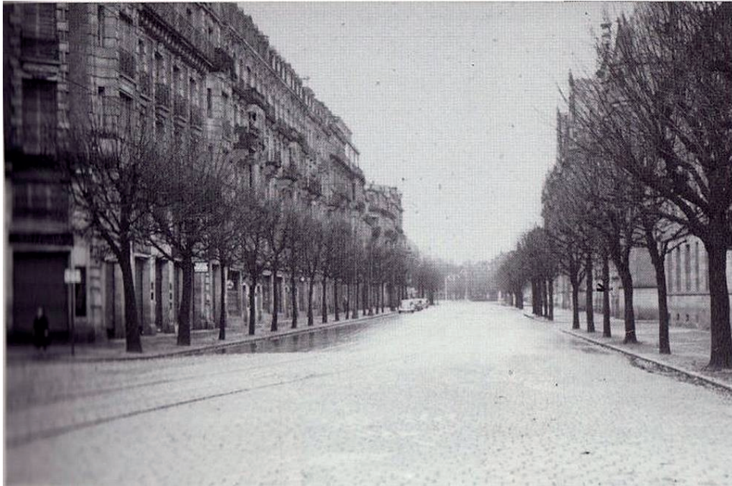
Avenue de la Marseillaise en 1940