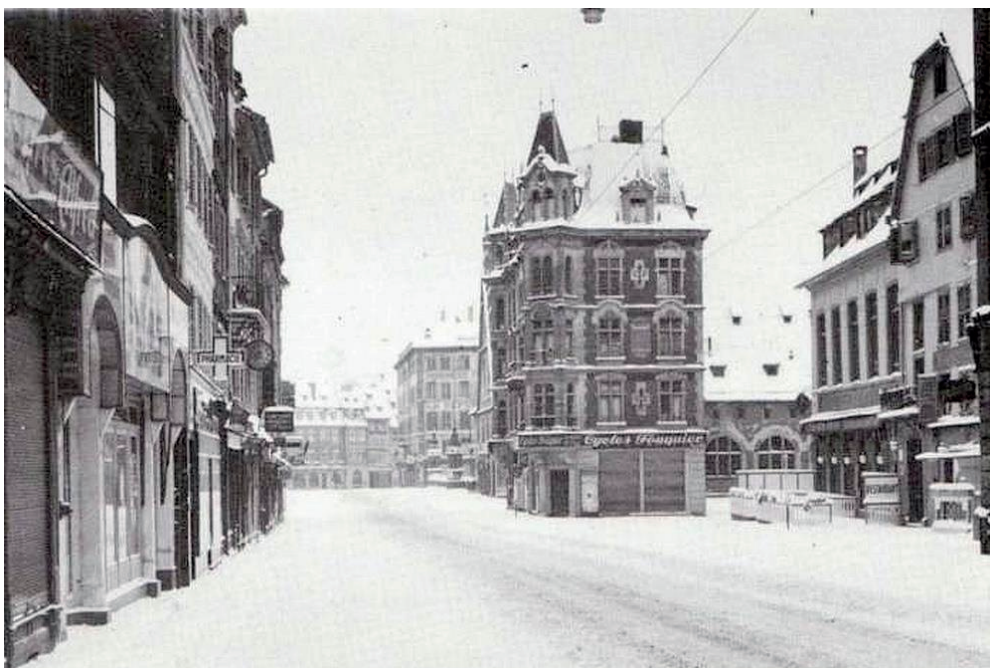
Rue du Vieux Marché aux Poissons, hiver 39-40