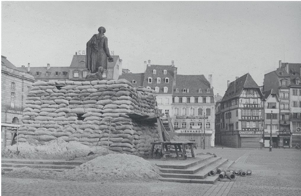
Place Kléber, la plus grande place de Strasbourg