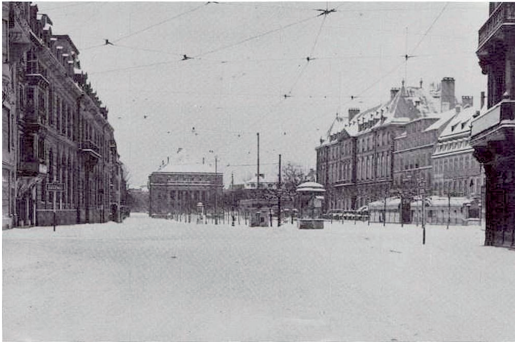
Place Broglie pendant l'hiver 39-40