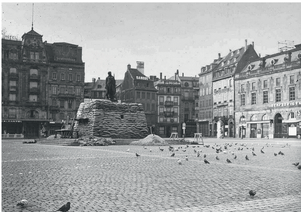
Protection de la Statue Kléber avec des sacs de sable en 1939