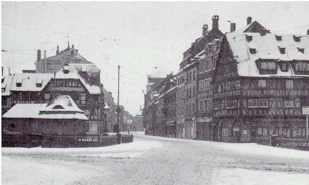
Pont du Faubourg National, hiver 39-40