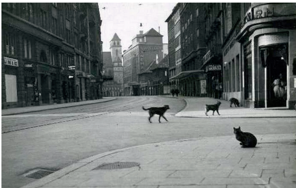
Rue du 22 Novembre en 1940