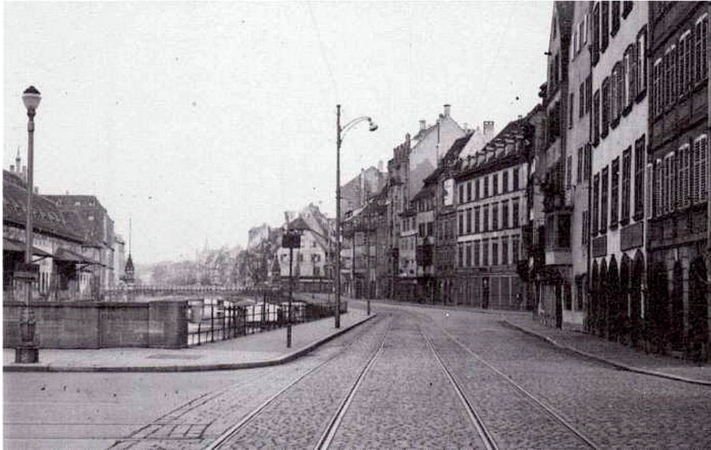
Quai Saint Nicolas