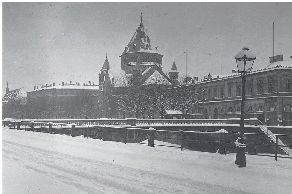
Le quai Kellerman et en arrière-plan, l'ancienne gare et la synagogue, (hiver 39-40)