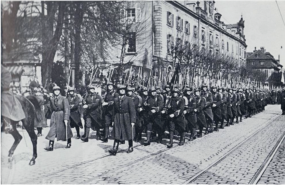
Défilé des troupes de la garnison strasbourgeoise sur la Place Broglie en mars 1940