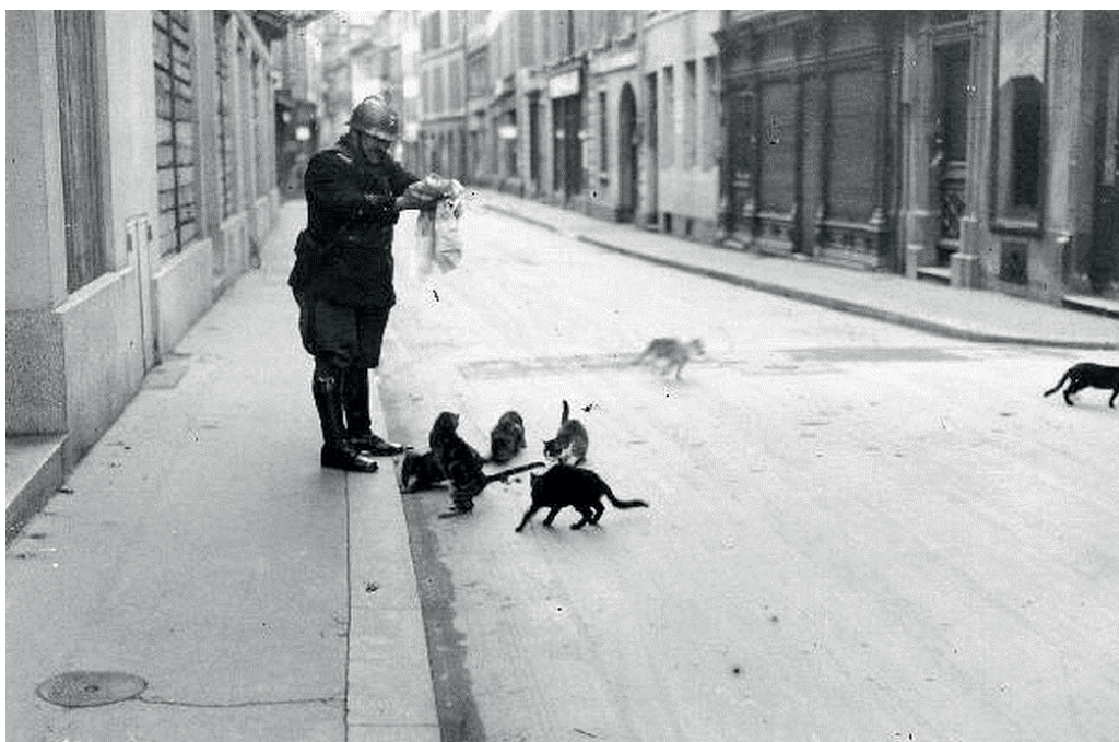
Garde municipal nourrissant des chats en 1939