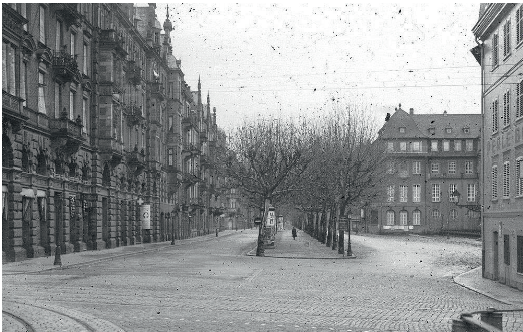
Boulevard de la Victoire en 1939 : Gallia, cité universitaire, bâtiment à gauche et bains municipaux, bâtiment, au fond à droite.