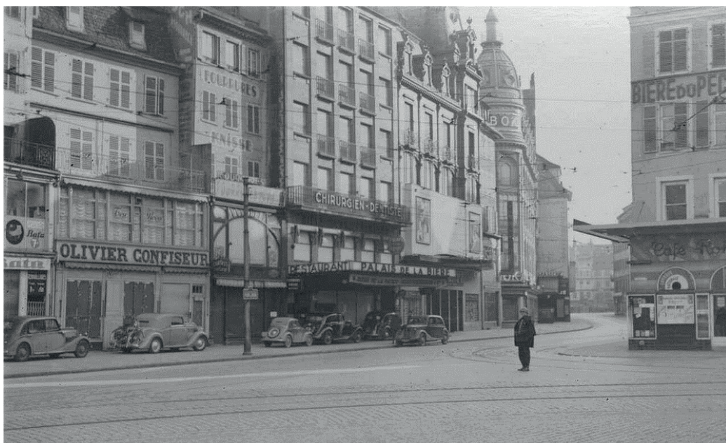
Place Kléber (Palais de la bière) en 1939