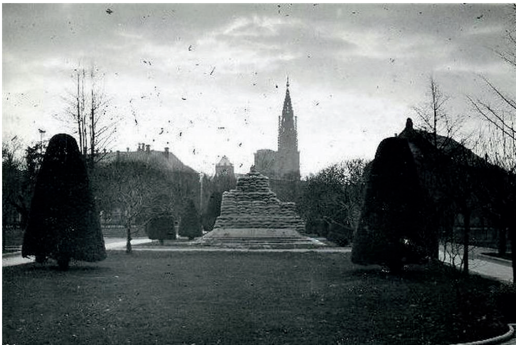
Place de la République en 1940