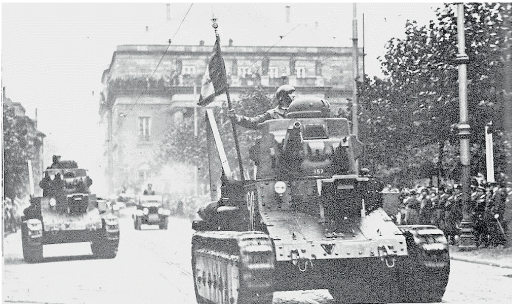
4 octobre 1939 : défilé des troupes de la garnison de Strasbourg en présence du général Gamelin