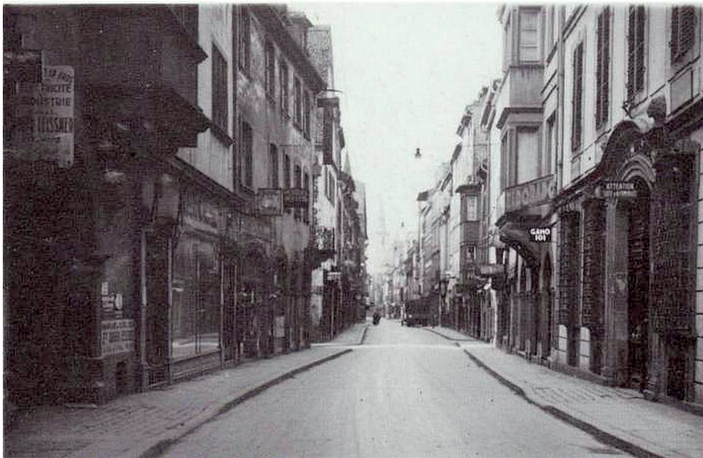
Grand Rue en 1939