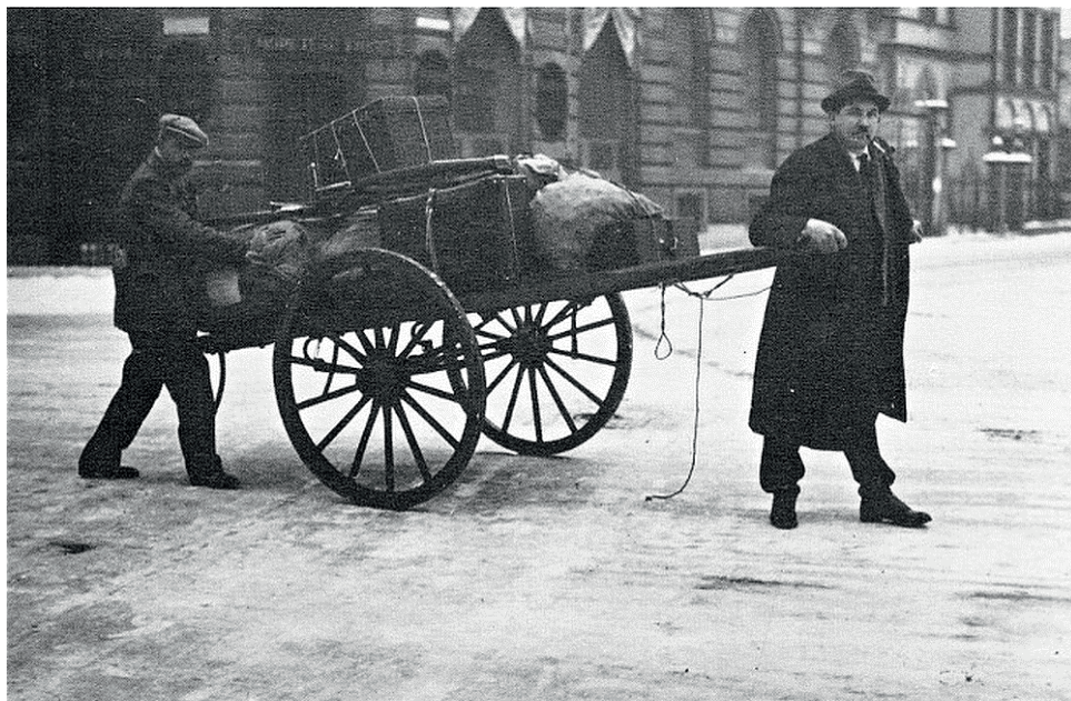
Strasbourgeois commençant l'exode, rue Massol