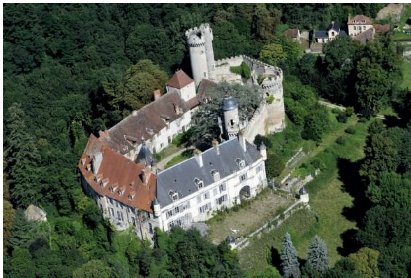
Le château de Veauce