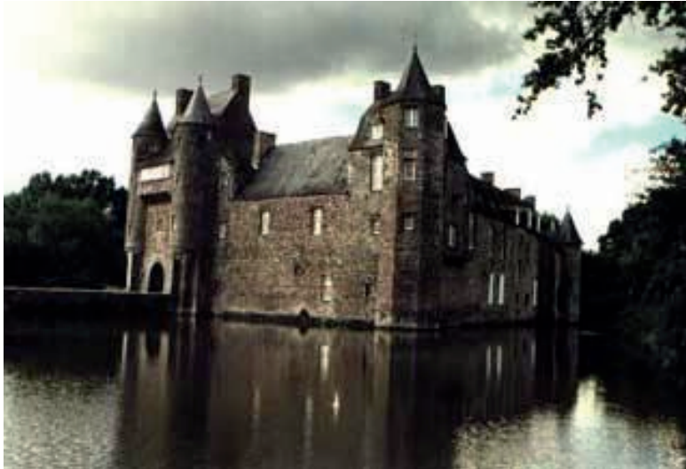
Le château de Trécesson