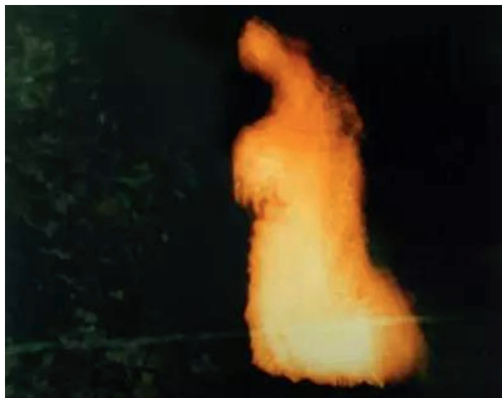
La présumée dame blanche de Mortemer

Monument historique niché dans l'Eure, l'Abbaye de Mortemer est depuis longtemps marquée par de nombreuses manifestations paranormales. La principale restant cette mystérieuse dame blanche, identifiée comme étant Mathilde l'Empresse, la fille du fondateur du lieu. Une photographie du fantôme a même été prise en 1999, attestant de cette présence inquiétante. Néanmoins, l'équipe RIP (Recherches Investigations Paranormales) a mis fin au mystère en réussissant à reproduire à l'exactitude le fameux cliché, prouvant que l'apparition était due à l'environnement et à un savant jeu de lumière.