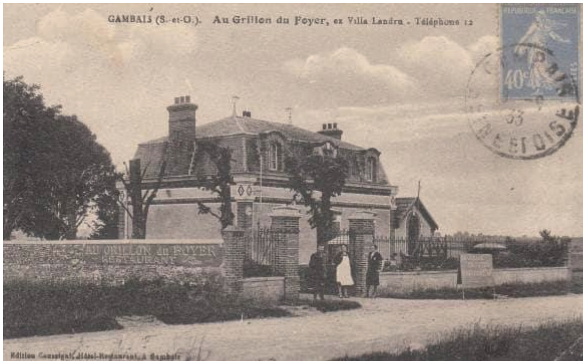
La maison de Landru