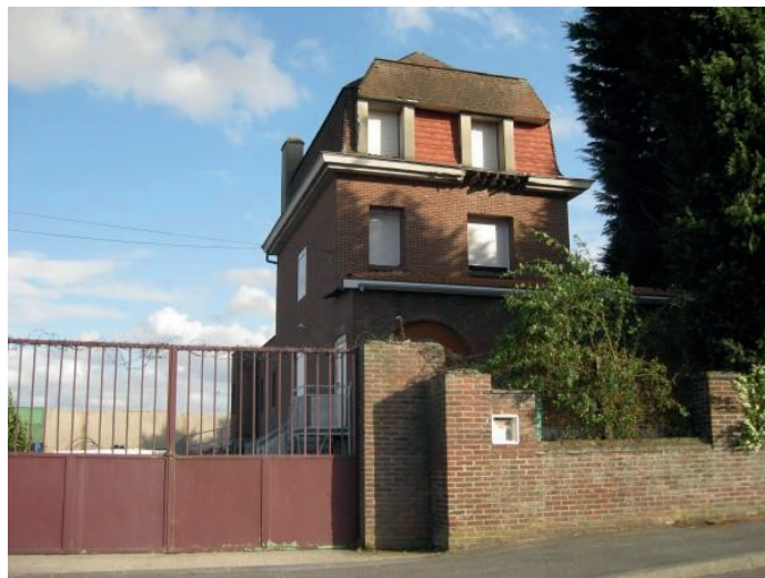
La maison de l'avenue de l'Hippodrome à Lambersart (Nord)