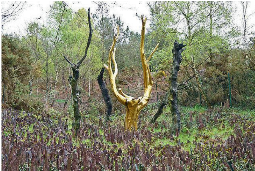
L'arbre d'Or du Val sans retour

Lieu mythique appartenant à la légende du Roi Arthur et de Merlin l'enchanteur, la forêt de Brocéliande est un endroit incontournable pour tous ceux qui cherchent à vivre une expérience paranormale et pour les admirateurs de Chrétien de Troyes. Merlin lui-même y vivrait encore, emprisonné quelque part. La fontaine de Barenton où le magicien rencontrait la douce Viviane, aurait le pouvoir de faire pleuvoir. Le Val sans retour pourrait retenir ses visiteurs. Quant au Château de Trécesson, il abrite apparemment plusieurs fantômes dont celui d'une dame blanche. Brocéliande n'a pas fini de dévoiler ses charmes et continue de fasciner.