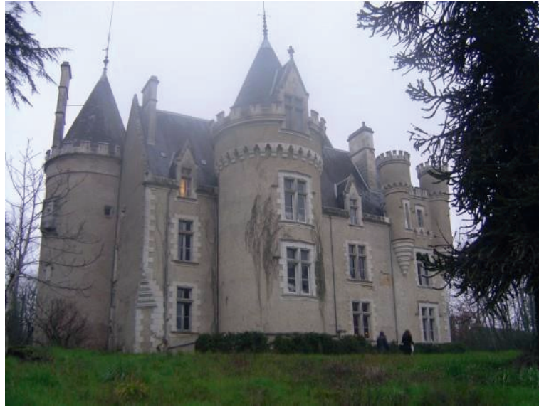
Le château de Fougeret

deux fois près de la cheminée, telle est la vie à Fougeret. Il ne faut pas s'offusquer ou se moquer », racontent-ils en effet.