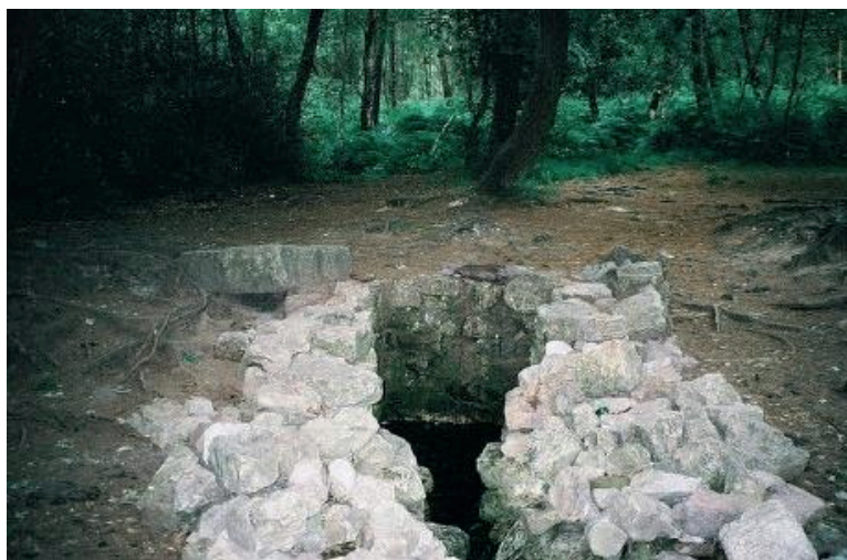
La fontaine de Barenton.

Lieu mythique appartenant à la légende du Roi Arthur et de Merlin l'enchanteur, la forêt de Brocéliande est un endroit incontournable pour tous ceux qui cherchent à vivre une expérience paranormale et pour les admirateurs de Chrétien de Troyes. Merlin lui-même y vivrait encore, emprisonné quelque part. La fontaine de Barenton où le magicien rencontrait la douce Viviane, aurait le pouvoir de faire pleuvoir. Le Val sans retour pourrait retenir ses visiteurs. Quant au Château de Trécesson, il abrite apparemment plusieurs fantômes dont celui d'une dame blanche. Brocéliande n'a pas fini de dévoiler ses charmes et continue de fasciner.