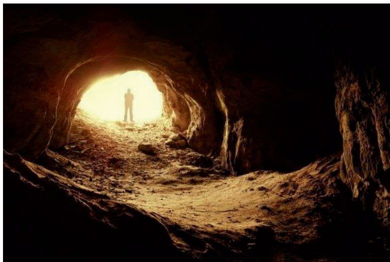
La grotte de Baumo-Seguro

Au XIXe siècle, le célèbre truand, Pierre de la Vache, avait trouvé refuge dans cette grotte à Ménerbes. Son frère, resté honnête, le dénonça à la police, mais lorsque les policiers arrivèrent pour l'arrêter, il décida de le précipiter lui-même dans le vide et de se suicider avec lui pour ne pas être condamné à mort par la justice. On raconte que les fantômes des deux frères se promènent toujours du côté de la grotte Baumo-Seguro et qu'ils s'amuse à pousser les passants du haut de la falaise.