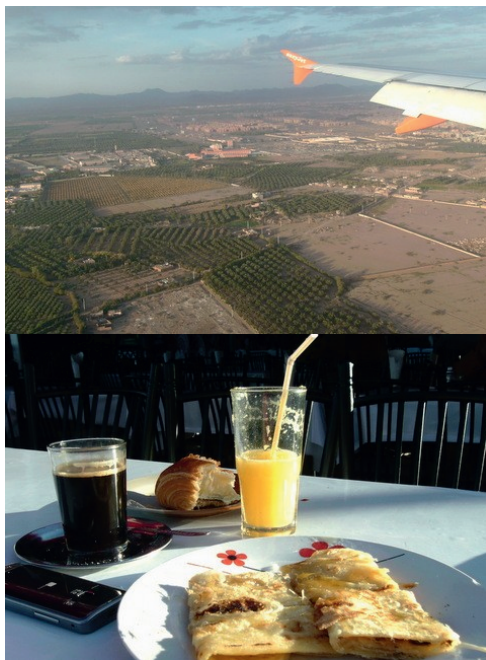
Pour deux euros vingt, je dégustais ce petit déjeuner dans Marrakech...