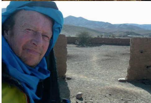
Ma coiffe locale me fut installée par le vendeur d'un souk très aimable...