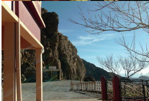
L'auberge au col Tizi-n-test, d'où je descendis à pied en coupant les lacets de la route magnifique...