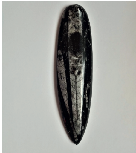
Fossile d'Orthocère ; grottes de Foulon. Châteaudun.

Nous envisageons le monde selon un a-priori existentiel privilégiant l'être humain au détriment de toutes les espèces qui nous ont précédés ou nous accompagnent sur le chemin de l'évolution. Des millénaires, des siècles de civilisations s'efforcent d'édulcorer un sentiment d'inachevé, inné, toujours latent, celui de l'absurdité d'un modèle humain faisant fi d'un environnement biologique extérieur et le soumettant par caprice ou volonté d'échapper à sa condition animale. L'omniprésence imaginative mais arrogante d'une psyché prédatrice, se heurte à un principe de vérité pour lequel la sélection naturelle répartit ses choix, en éliminant pour toujours les structures entropiques déficientes.