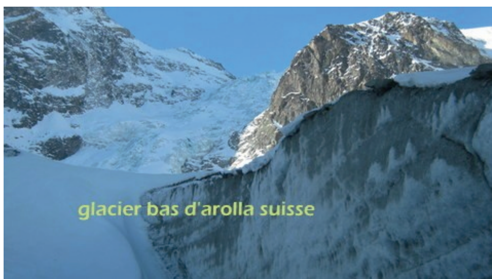
glacier bas d'arolla suisse