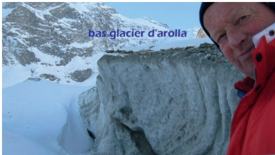
bas glacier d'arolla