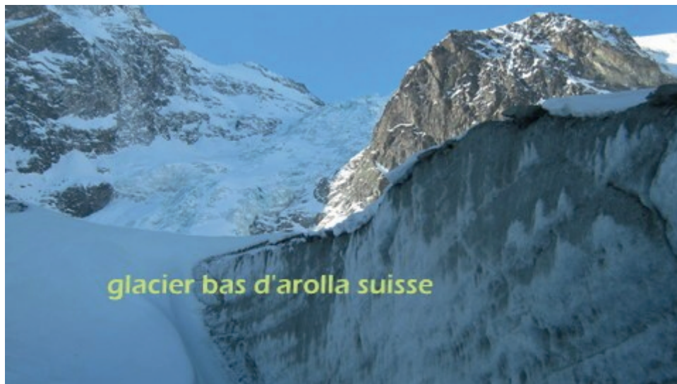
glacier bas d'arolla suisse