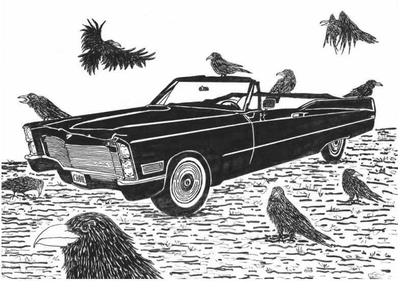
La Cadillac décapotable noire et les corbeaux pourchasseurs.