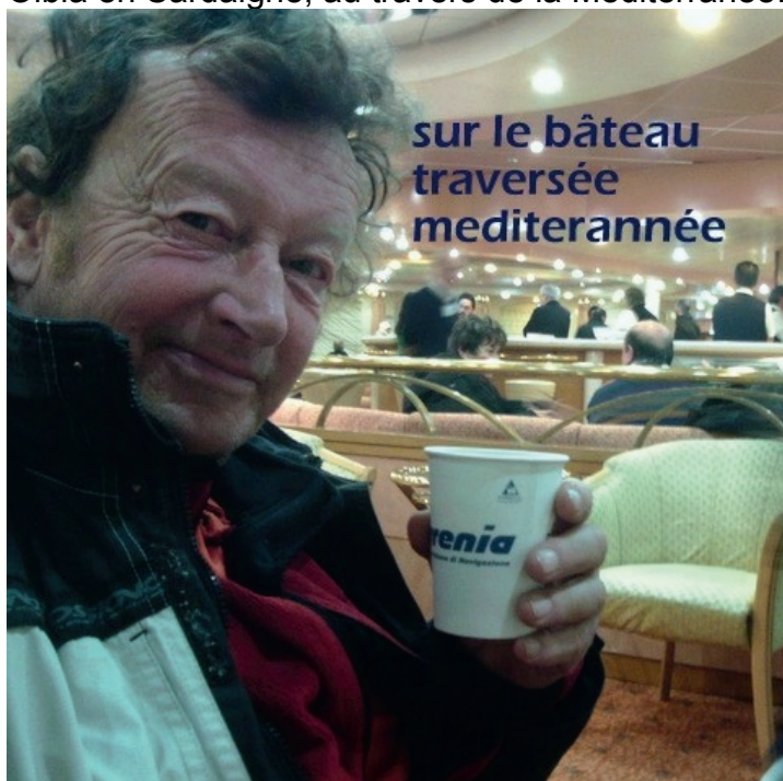
sur le bateau traversée mediterranée