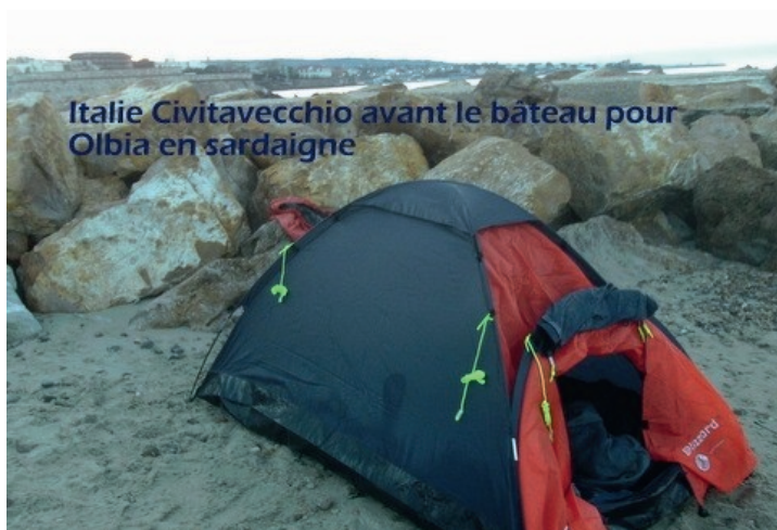
Italie Civitavecchio avant le bateau pour Olbia en sardaigne