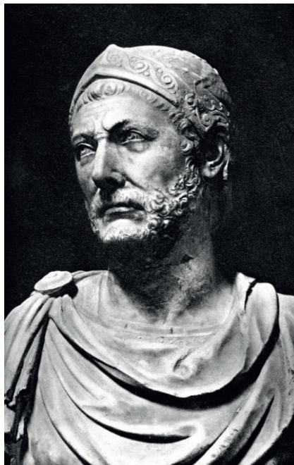
Buste d'Hannibal (247 av. J.-C. Entre 183 av. J.-C. et 181 av. J.-C)

À Cannae, dans le sud-est de l'Italie, en 216 av J-C, le général carthaginois Hannibal infligea à Rome la plus grande défaite de son histoire : les 40 000 hommes d'Hannibal l'emportèrent sur une armée romaine de 80 000 hommes. Ce coup de génie d'Hannibal est considéré comme une des plus grandes démonstrations de génie tactique, encore étudié de nos jours en école militaire.