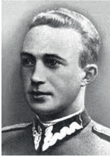
Władysław Raginis, (1908-1939)