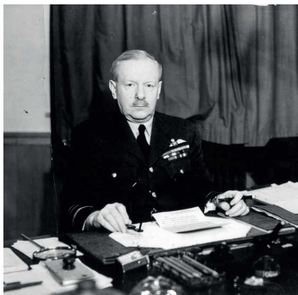
Arthur Travers Harris (1892-1984)

Arthur Travers Harris était un commandant de la Royal Air Force durant la Seconde Guerre mondiale, chargé de superviser les bombardements sur l'Allemagne. Surnommé Harry le Boucher par ses subordonnés, il était partisan de bombardements sur des populations civiles en violation des lois de la guerre, afin de saper le moral de la population. Malgré ses actes, il ne fut jamais poursuivi par la suite pour crime de guerre.