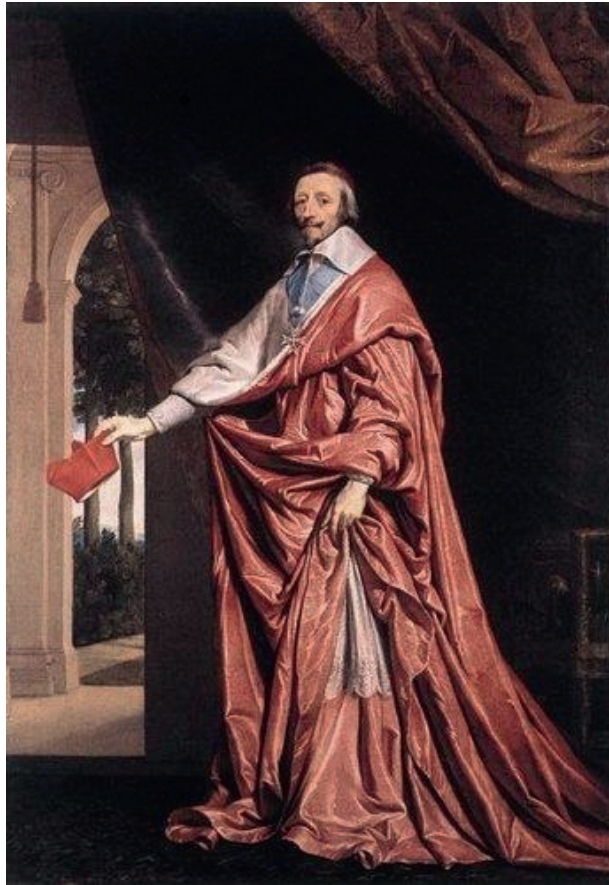
Tableau de Philippe de Champaigne

150 ans après sa mort, en 1793, des révolutionnaires exhumèrent sa dépouille et lui firent subir le même sort que Louis XVI : ils décapitèrent son cadavre et sa tête fut jetée à la foule.