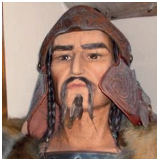
Portrait d'Attila (reconstitution)

Attila, célèbre roi des Huns du Ve siècle, fréquemment appelé Attila le Hun, né aux alentours de 395 dans les plaines du Danube et mort en mars 453, dans la région de la Tisza dans l'Est de la Hongrie actuelle, est le souverain des Huns de 434 jusqu'à sa mort en mars 453. Il a laissé en Europe occidentale une image d'empereur cruel et violent. Mais ce n'est pas le cas partout: en Hongrie par exemple, il est considéré comme un héros fondateur et Attila y est un des prénoms masculins les plus répandus parmi la population.