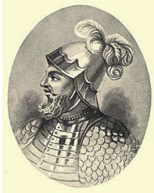
Vasco Núñez de Balboa (1475-1519) explorateur et homme politique