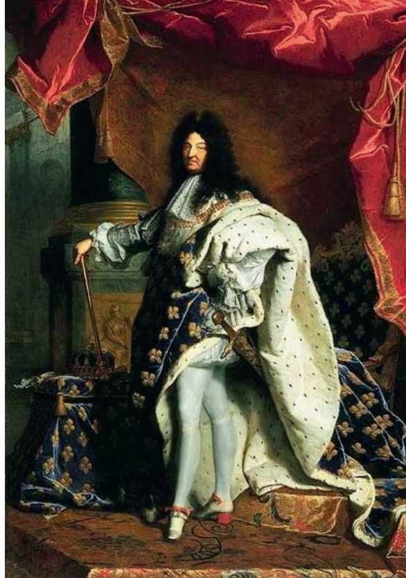
Portrait de Louis XIV, roi de France de 1638 à 1715, en costume de sacre (par Hyacinthe Rigaud, 1701)

Le port de la perruque par la noblesse française fut un temps à la mode sous Louis XIII. Plus tard, Louis XIV, à l'âge de 20 ans, perdit ses cheveux des suites de la typhoïde, et adopta alors la perruque pour cacher sa calvitie. La cour reprit aussitôt cette mode, qui dura 150 ans.