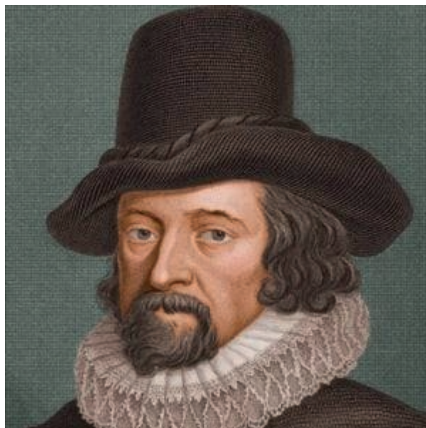
Francis Bacon (1561-1626)

Le philosophe Francis Bacon inventa en 1605 un alphabet bilitère, uniquement composé des deux lettres A et B. C'est en quelque sorte l'ancêtre du système binaire des ordinateurs actuels car toute lettre pouvait être construite avec un enchaînement précis de ces deux lettres, tandis que le système binaire informatique utilise 0 et 1.