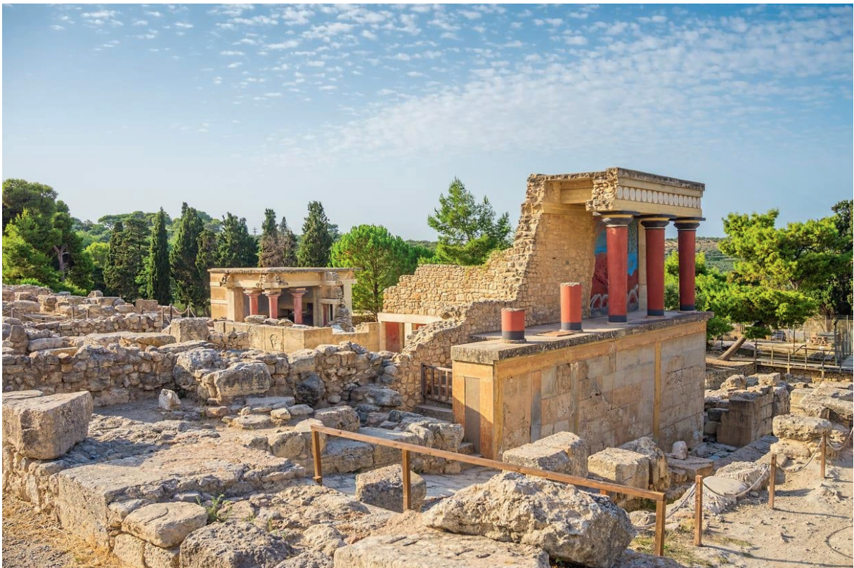
Les ruines du palais telles qu'on peut les voir de nos jours