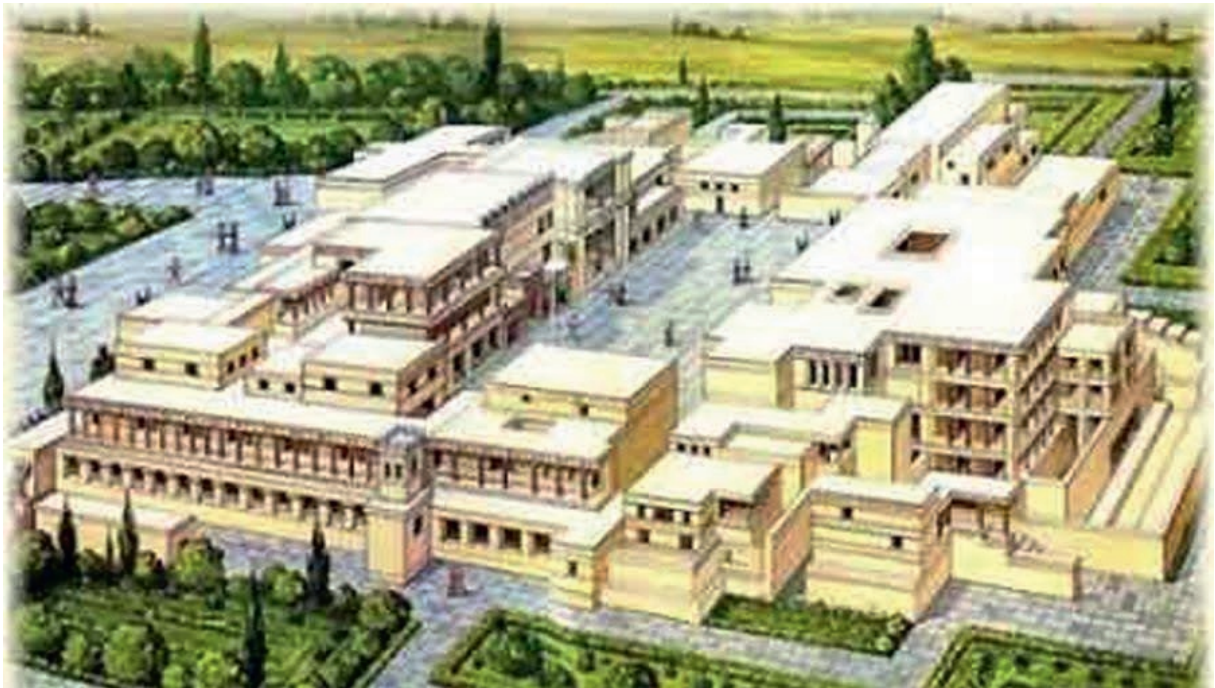
Reconstitution du palais de Cnossos

d'une civilisation très avancée : la civilisation minoenne. Cette civilisation a périclité vers - 1500 dans des circonstances encore peu claires.