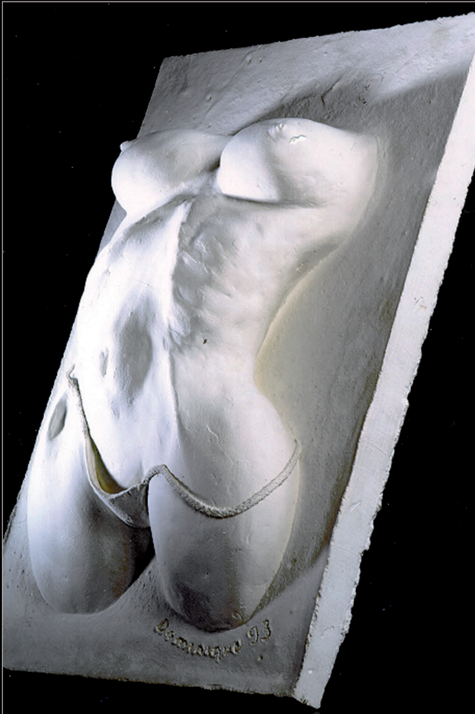
« Aumône » - Terre crue et ciment - 48 x 32 x 10

Troisième tentative, premier modelage. Third attempt, first modeling.