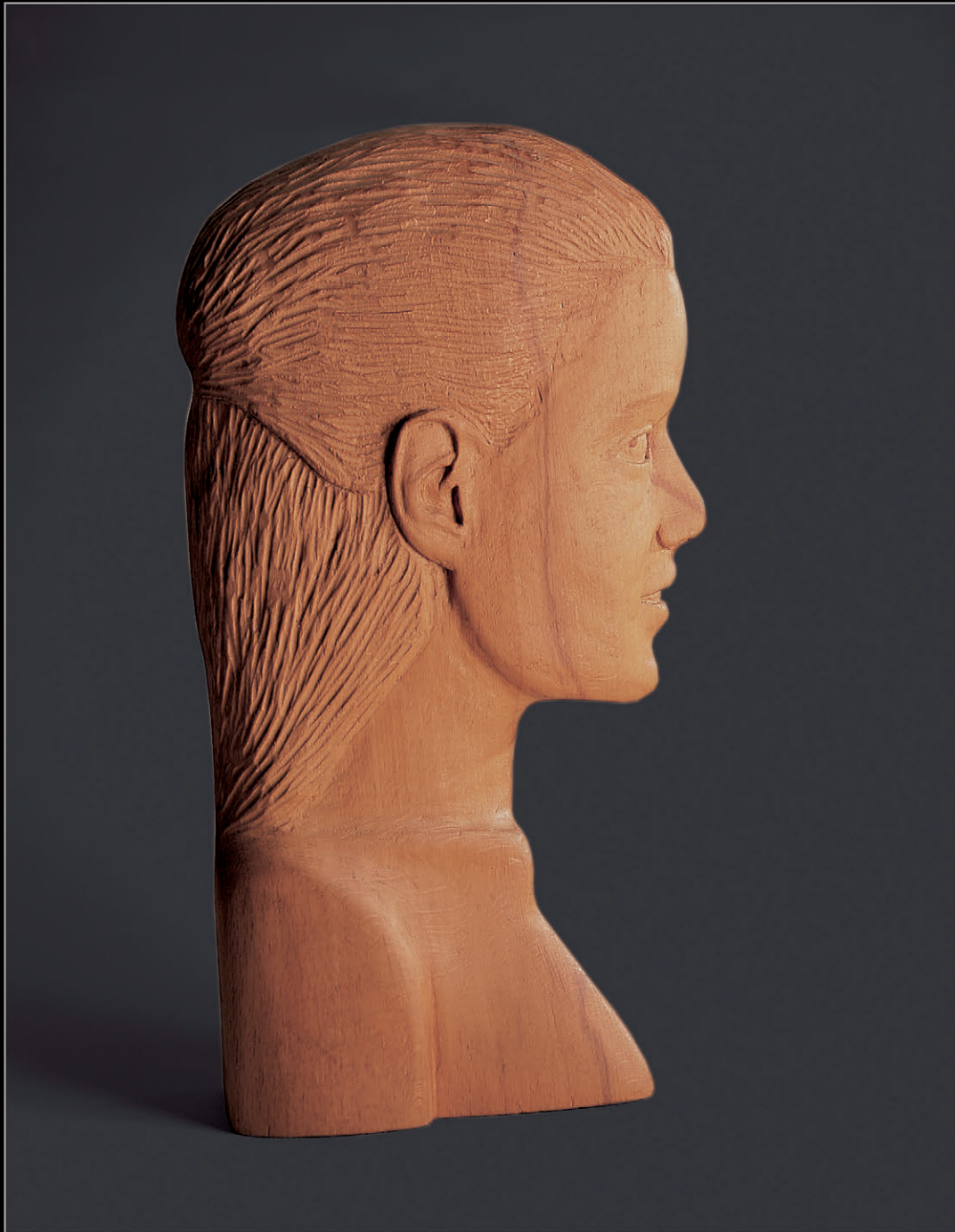
« Sans nom » - Hêtre - 28 x 16 x 14

Première oeuvre réalisée dans l'atelier sculpture d'un centre de vacances à Cogolin. First achievement in the holiday center studio carving in Cogolin.