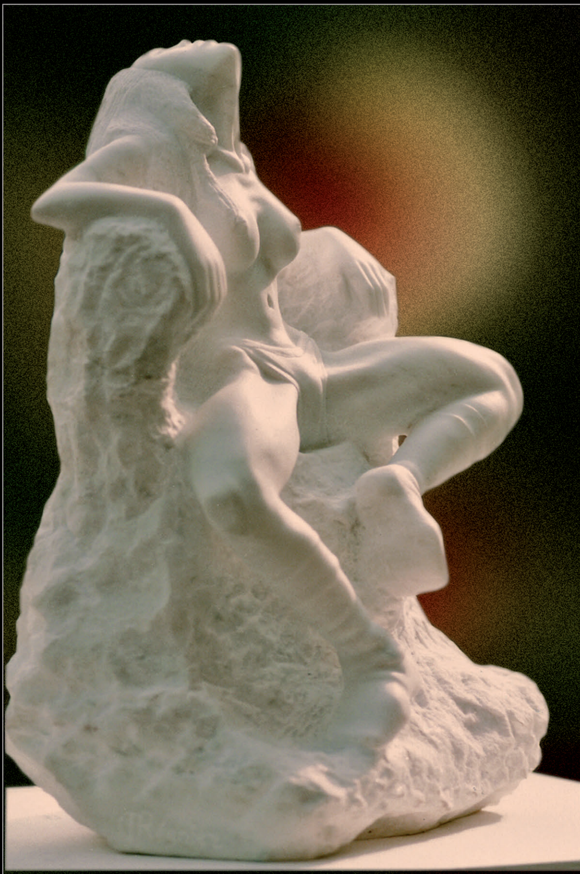
« Janice » - Marbre de Carrare - 46 x 35 x 23