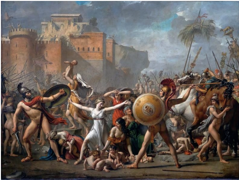
Tableau de Nicolas Poussin