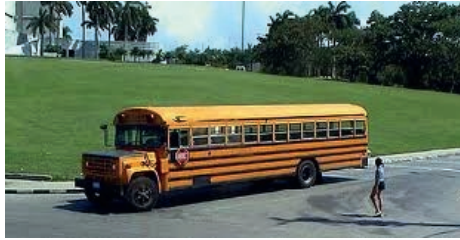
Le bus des quatre filles de Dieu

reviennent, recommencer à chaque fois, qu'elles ont relâcher depuis quelque temps.