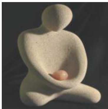
(Sculpture d'Ash Fraser : méditation)

Cela paraîtrait trop encombrant ! Voir cette illustration de cette statuette, bas-relief et comprendre l'esprit même de l'expérience d'écrire ce récit. L'inspiration multidimensionnelle.