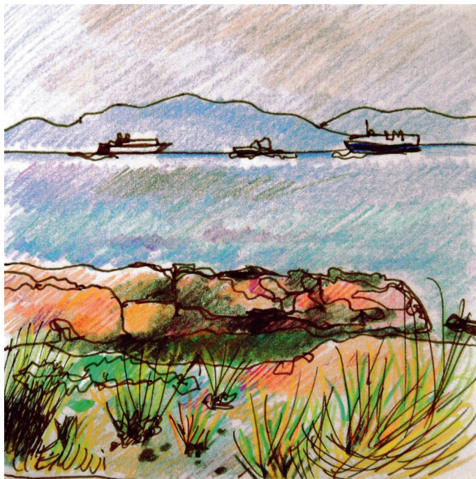
Le 10, 20 h 30. Plakakia, trois bateaux