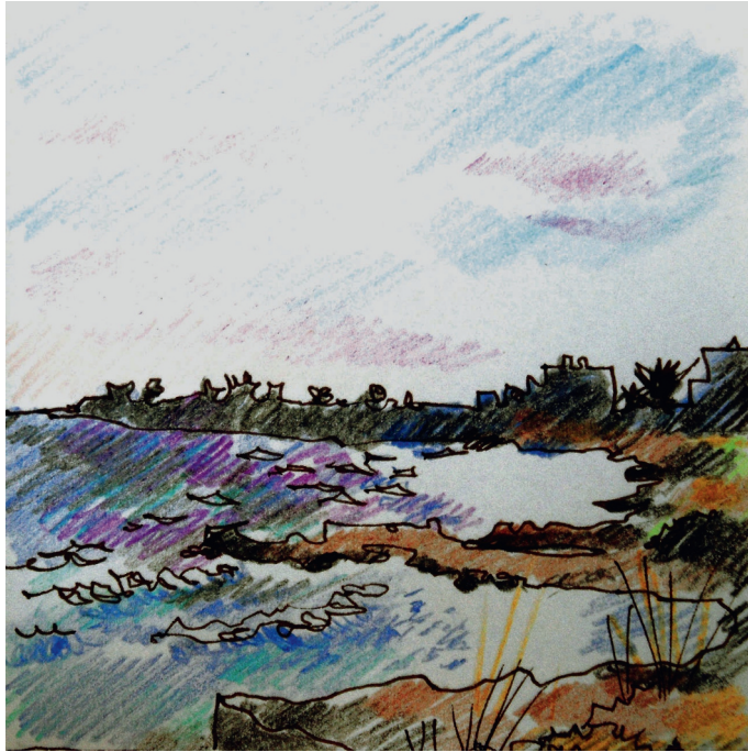
Le 2, 8 h. Plakakia, les vagues