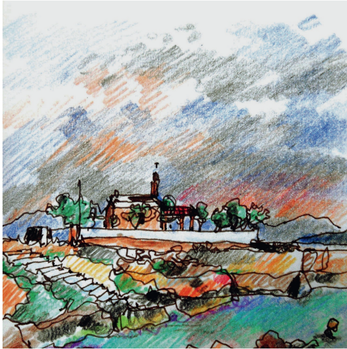
Le 1er, 18 h 30. Plakakia, bain après l'orage