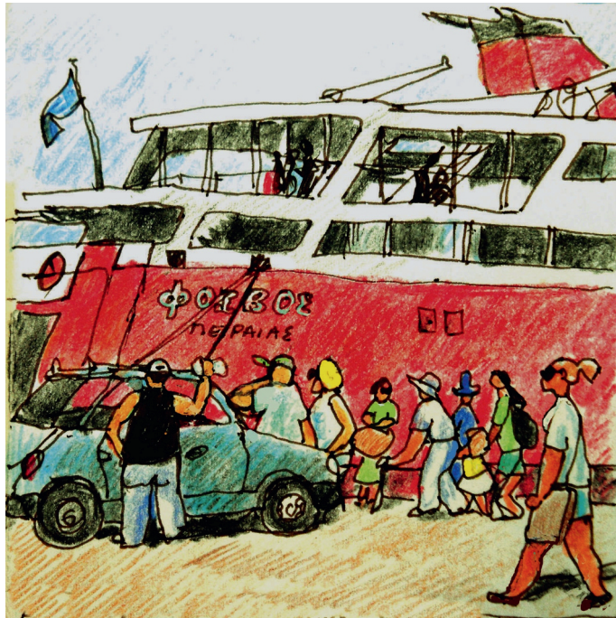
Le 3, 9 h. Egine, Le Phivos arrive