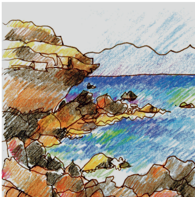
Le 8, 10 h. Plakakía, la plage à la gauche du phare