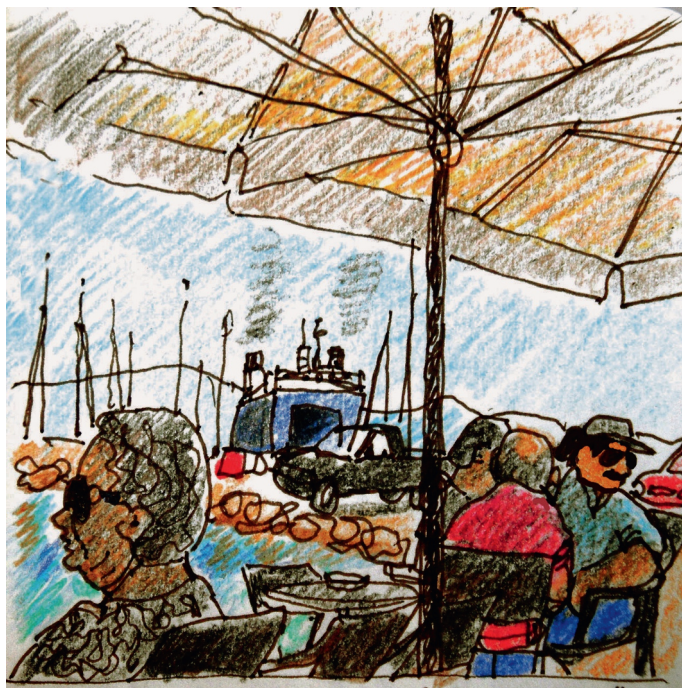
Le 7, 10 h. Egine, au thermopolion Panagitsa