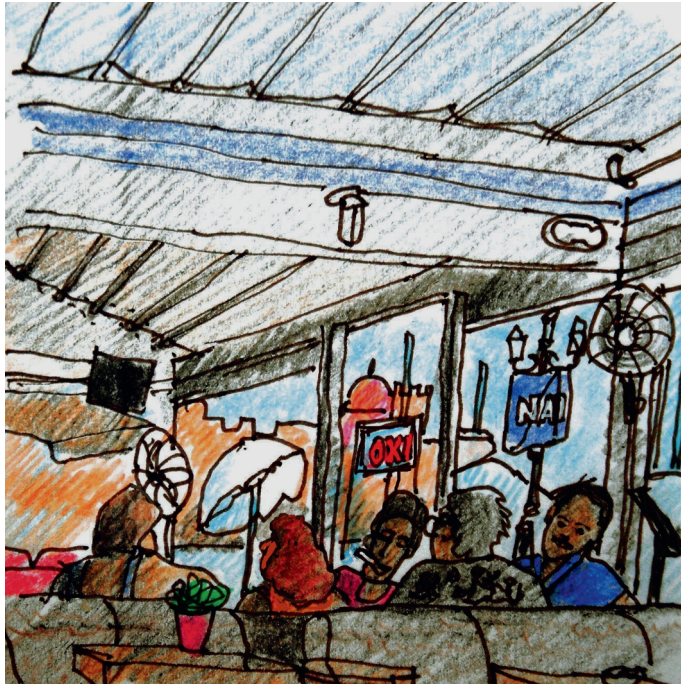
Le 5, 10 h. Eglise, aujourd'hui on vote oui ou non pour le référendum