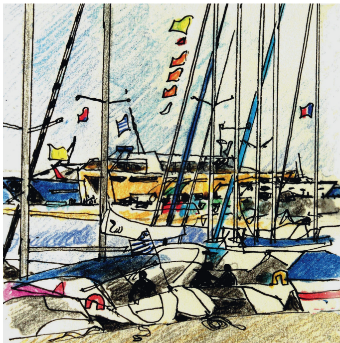
Le 7, 11 h. Egine, la paralia