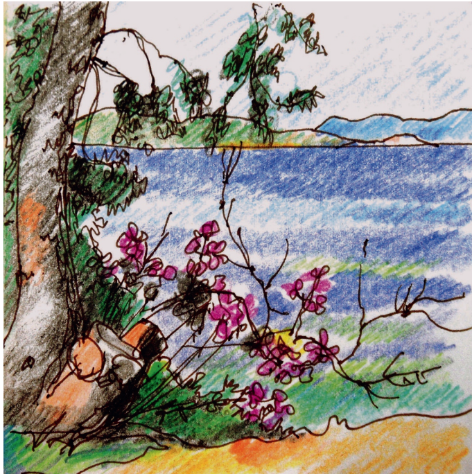
Le 4, 8 h. Plakakía, devant l'hotel Danaé