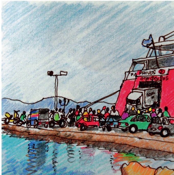
Le 9, 9h. Egine, le Phivos décharge