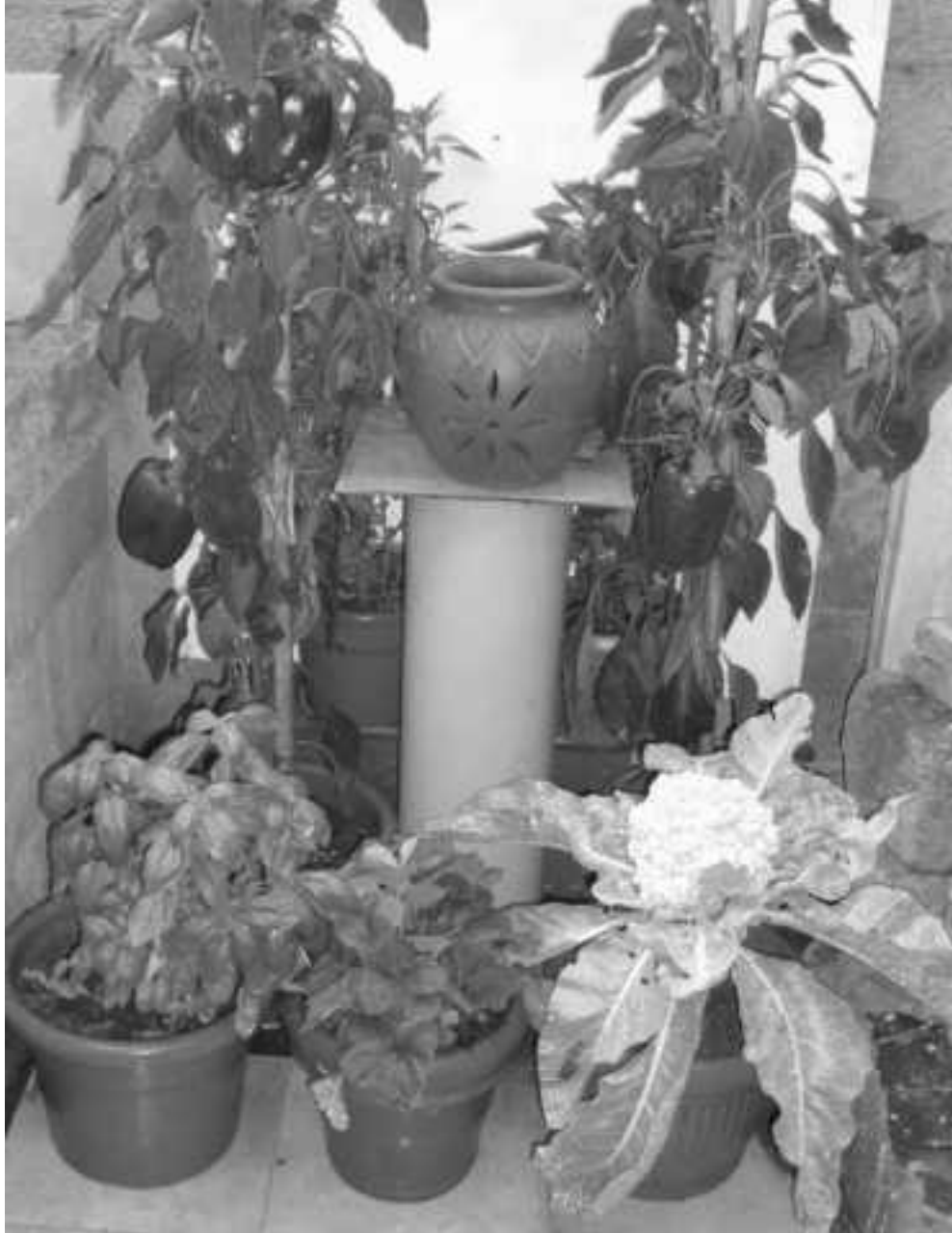
Un piccolo orto sul balcone arricchito da un elemento decorativo